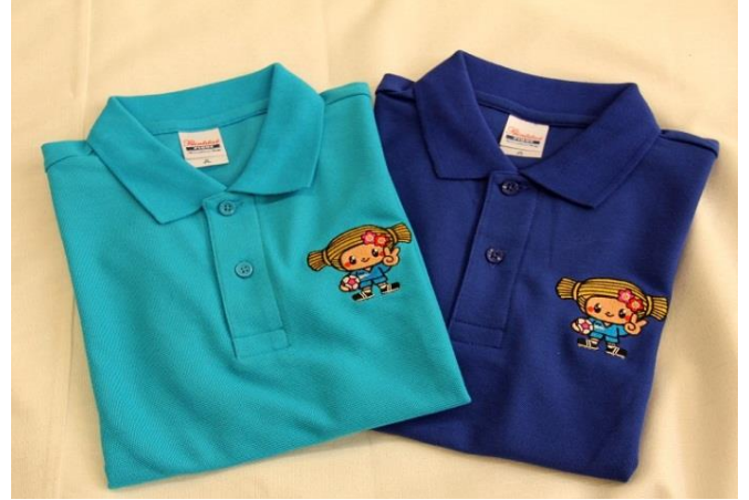
サッカー (2色) ¥1,800 (税込)

(左から)ホットピンク、サックス (水色)、 フォレスト (深緑色)、バーガンティ (えんじ色)、 ホワイト、メイジー (黄色)