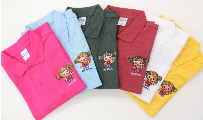
印籠 (6色) ¥1,600 (税込)

(左から)ホットピンク、サックス (水色)、 フォレスト (深緑色)、バーガンティ (えんじ色)、 ホワイト、メイジー (黄色)